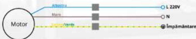
SCHITA 3. Motor cu telecomandă